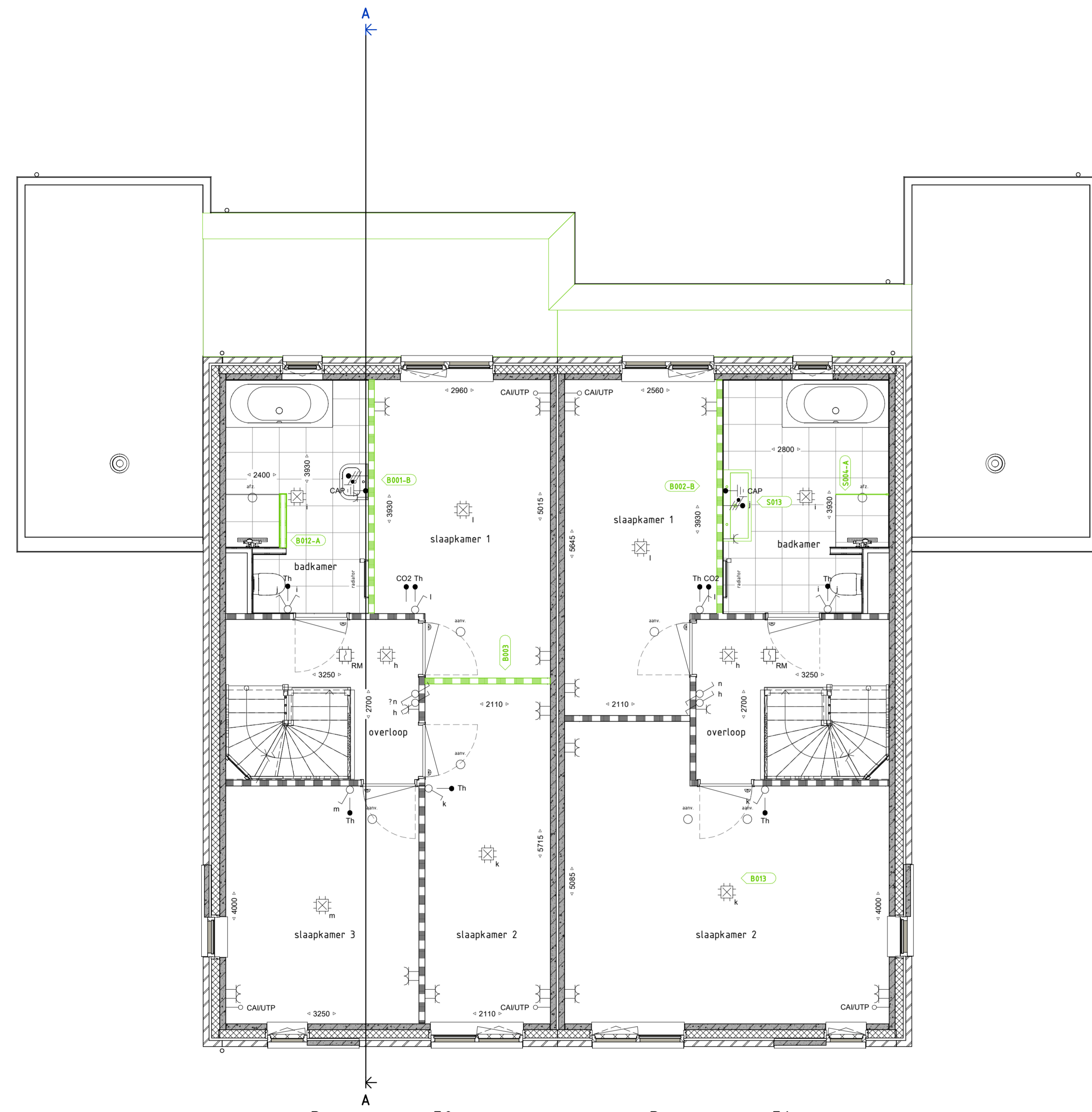
EERSTE VERDIEPING 1 : 50

B001-B - Badkamer - 300 mm vergroten - Luxe B002 - Verdieping - Vergaarden tussenwand slaapkamers B012-A - Badkamer - Lussenwan plaatsen - Comfort