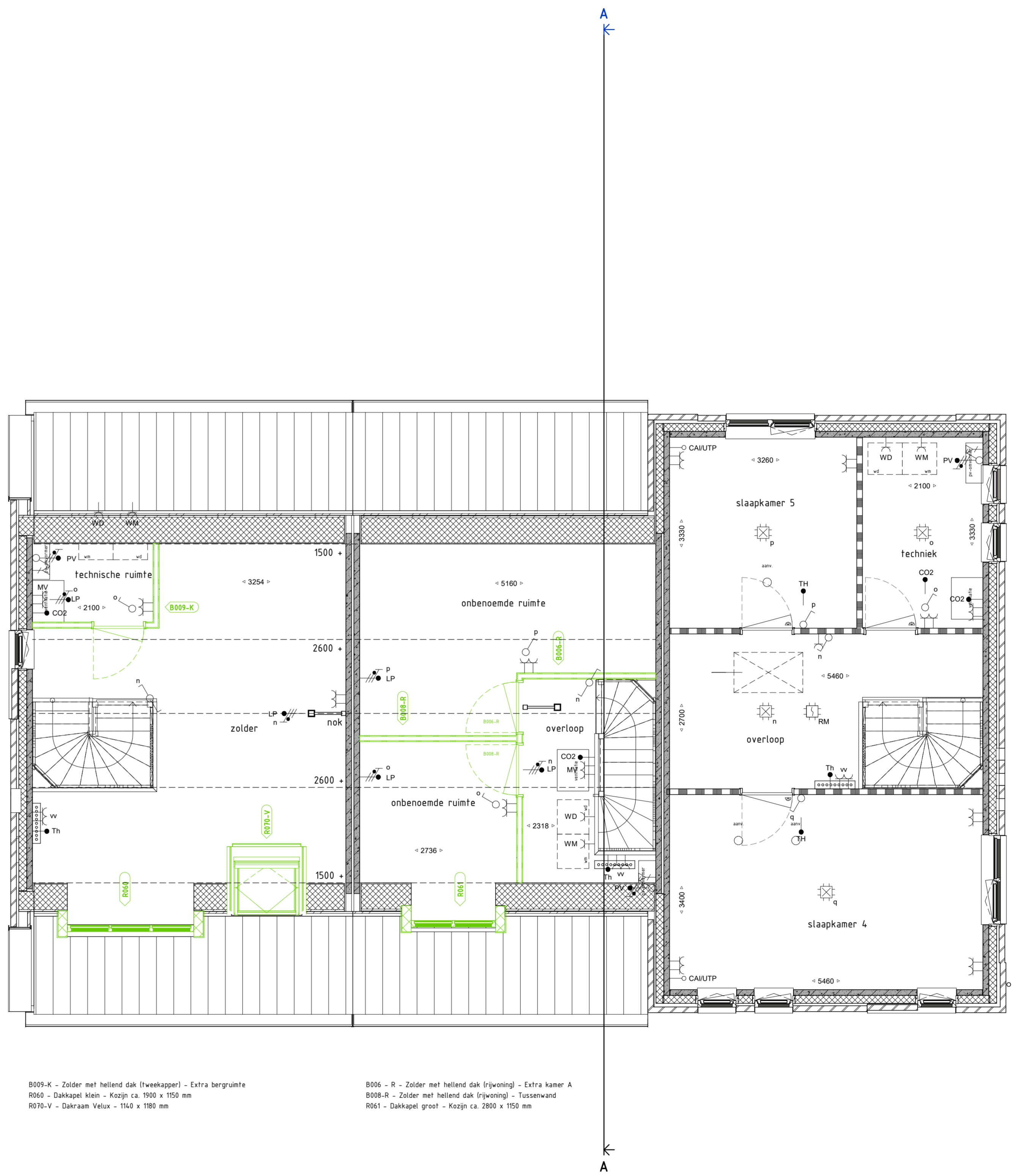
TWEDE VERDIEPING 1 : 50

B009-K - Zolder met hellend dak (tweekapen) - Extra bergruimte R066 - Dakkapel klein - Koepel ca 1900 x 1150 mm R070-V - Dakraam Velux - 1140 x 1180 mm